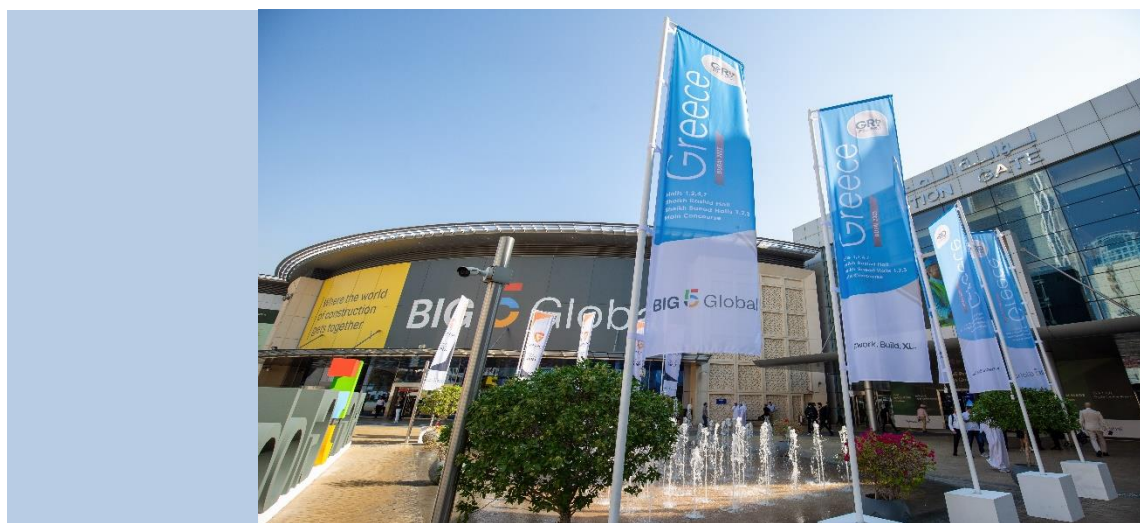
Η είσοδος του εκθεσιακού χώρου με το banner της διαφημιστικής προβολής της ελληνικής συμμετοχής

Η ελληνική συμμετοχή του 2023, με 57 εταιρείες, κάλυψε συνολικά έκταση περίπου 1.620 τ.μ.. Οι ελληνικές εταιρείες είχαν την ευκαιρία να εκθέσουν τα προϊόντα και τις υπηρεσίες τους και να προβάλλουν την δυναμική του κλάδου σε μεγάλο αριθμό επισκεπτών και επιχειρηματιών.